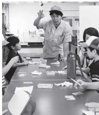
指導員の方の説明を熱心に聞く子供たち。

の人間がつく時代は終わり、今はプログラマーを書くことが人間の仕事になっている」という現場は自動化が進み、子供たちの中でも「昔気質の職人」という町工場のイメージが変わる経験となったに違いない。両社とも工場見学後には、社長自らが自社の活動を解説。職人の手が欠かせない現場とコンピュータ化が進む現場という対照的な2社を見学し、町工業の様々な形を学ぶことができた。 午後は城南職業能力開発センター大田校に場所を移してものづくり教室を行い、同校の指導員の方々のアドバイスを受けながらアルミ合金のテープカッターを作成。オリジナルデザインのテープカッターは、旋盤、レーザーカッター、万力、タップハンドルなど使うもので、加工の基礎を自らの手を動かしながら学ぶことができた。訪問した各所の多大な協力もあり、当初の予定通り午後4時半に一日のプログラムは終了。貴重な経験あり、自ら作ったおみやげありで、子供たちは皆、充実した表情を見せていた。