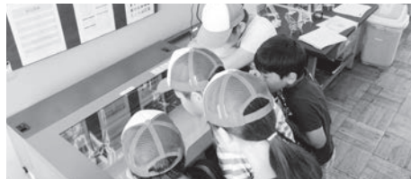
レーザーカッターがアクリル板を切る様子に興味津々。