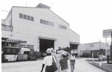
ヘルメットをかぶり、安全最重視で2社の工場を見学。