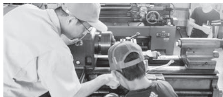
初めての旋盤体験にドキドキ!