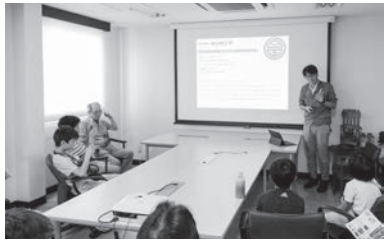
現場見学後は会議室で社長自ら自社のものづくりを解説。